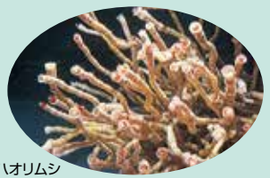
サツマハオリムシ